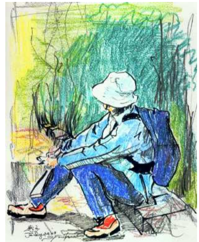
【萩往還ウォーカー】