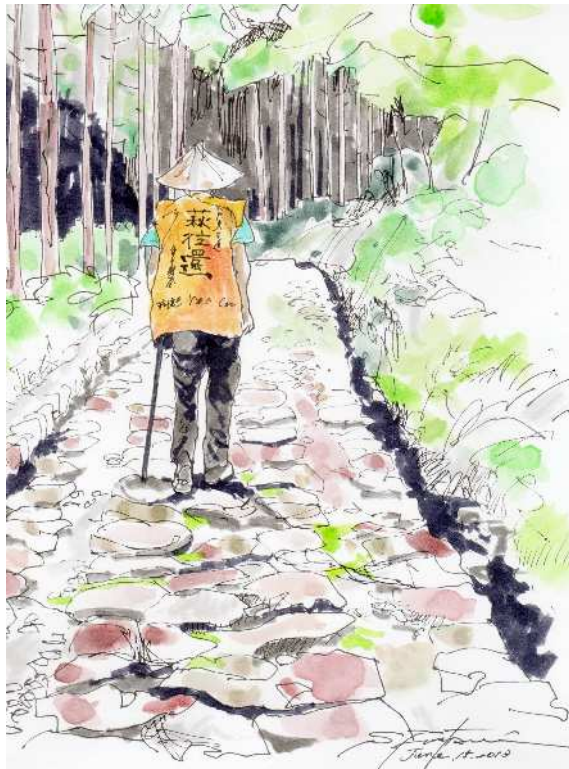
【一升谷をゆく語り部】