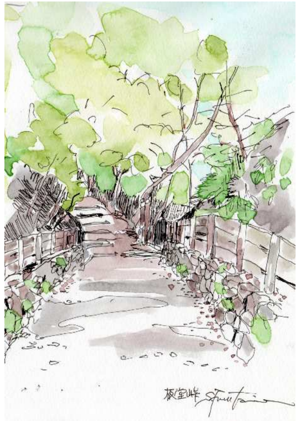
【板堂峠 標高 537m】 【四十二の曲がり】